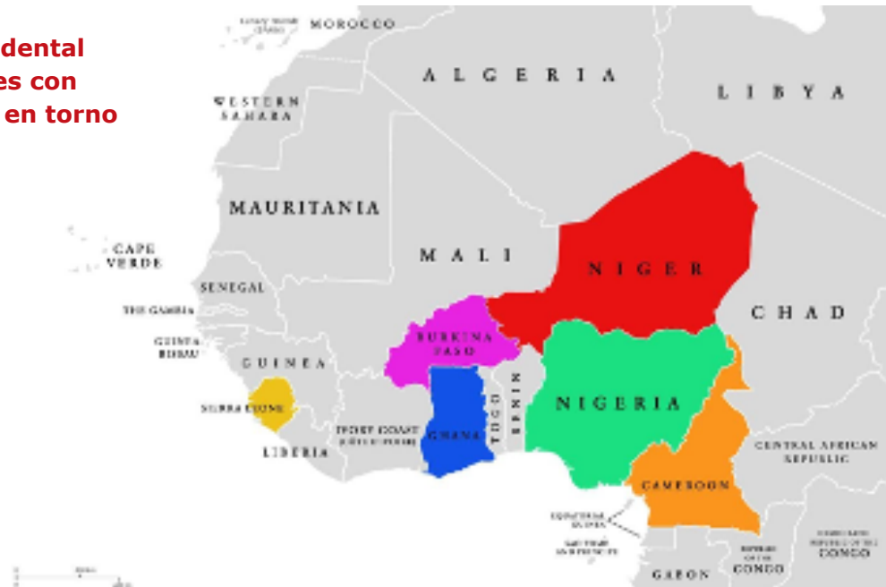
Ilustración 4: Mapa de África Occidental mostrando los países con actividades de CBM en torno a la salud mental

Sierra Leona: El programa 'Habilitando el Acceso a la Salud Mental en Sierra Leona' (EAMH-SL, por sus siglas en inglés), fue lanzado por CBM, y sus socios ( City of Rest , la Asociación Comunitaria para Servicios Psicosociales y la Universidad de Makeni) para fortalecer los Servicios de Salud Mental. El programa también ofreció Foros sobre Salud Mental Comunitaria (CMHFs, por sus siglas en inglés), para reunir a las partes interesadas y realzar el involucramiento de la comunidad en torno a la salud mental. El Proyecto ' Building Back Better ' (Volviendo a Construir Mejor) también cuenta con el apoyo de CBM.