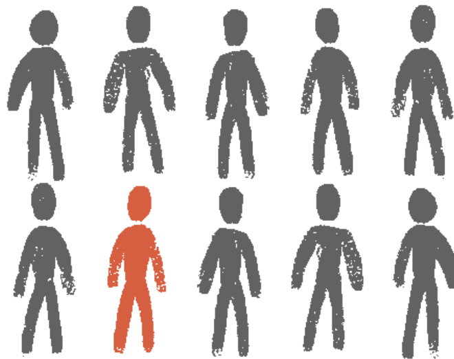
Ilustración 3: En el oeste de África, únicamente 1 de cada 10 personas recibe atención para sus necesidades en salud mental.

Las labores de defensa ( advocacy ) de CBM procuran alcanzar el bienestar y la salud para todos los ciudadanos, en línea con el 3er Objetivo de Desarrollo Sostenible (ODS3), y en línea con los principios de equidad, justicia y derechos humanos. Esto se puede lograr solo si existe un enfoque holístico hacia los sistemas de salud.