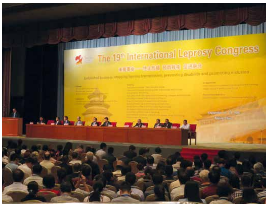
^ Conferencia inaugural donde participaron: el presidente de China, los presidentes de ILEP y del ILA, representantes de la OMS, de la Nipon Foundation, Novartis y de la asociación china de personas afectadas por lepra.

Durante el congreso se habló del ensayo de la primera vacuna contra la lepra que está a punto de iniciarse en India, el país con mayor número de casos del mundo. El aumento de los casos de lepra infantil en los últimos años, la aparición de resistencias a los medicamentos hasta ahora utilizados