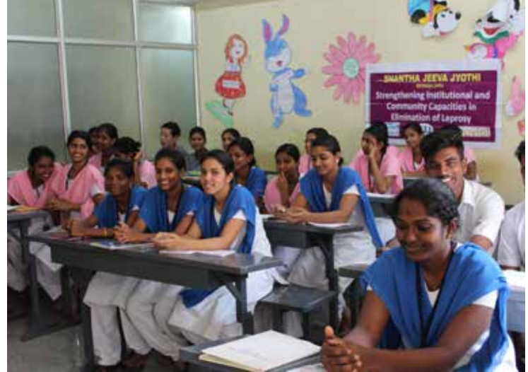
De izda a dcha, un paciente siendo curado de una úlcera y actividad de sensibilización para estudiantes voluntarios

acceso y zonas marginadas urbanas de Bangalore durante el año 2017.