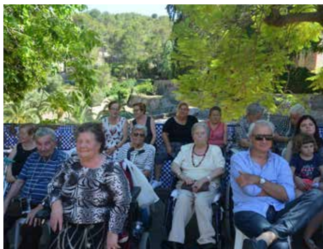
Arriba, el grupo "El Milagro" en la iglesia. Abajo, el grupo de baile "EL Milagro" durante su actuación en la plaza del Padre Ferrís y un grupo de residentes y amigos de Fontilles.